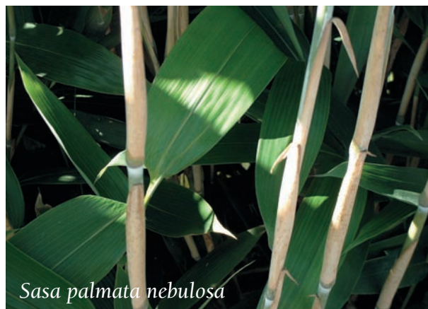
Sasa palmata nebulosa